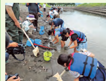
一生懸命に土を掘り、ていねいにコアマモを植えました。