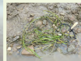
移植したコアマモ