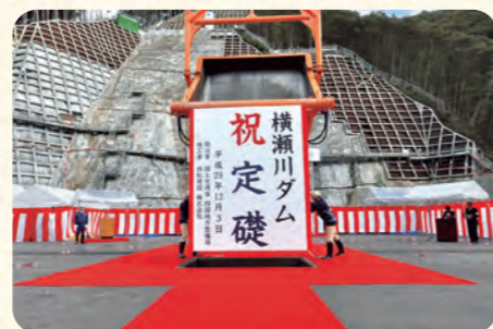
コンクリートを流し込む様子を実演

横瀬川ダムでは、平成29年5月10日に初打設を行い、ダムの型になるよう、コンクリートを順次流し込んでいます。平成30年3月1日時点で高さ72.1mのうち32.0m(全体コンクリート量の約35%)まで工事が進んでいます。