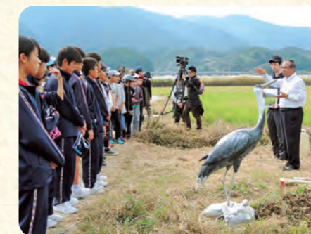
ツルの自然体験学習会