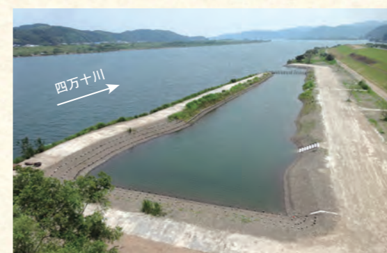
実崎箇所に整備したワンド (池のような形をしています、下流側で四万十川とつながっています)

たくさんの魚の赤ちゃんのすみかとなる「コアマモ」という水草が生える環境を再生するため、中村河川国道事務所が四万十川の実崎箇所に整備していた「ワンド」と呼ばれる流れの緩やかな浅場が、平成29年6月に完成しました。