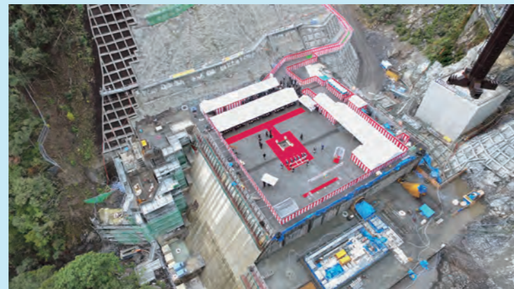
空から見た定礎式の様子

式典には、土地を提供して下さった方々をはじめとする地元関係者や国会議員、高知県、四万十市、宿毛市及び工事関係者など約200人が出席し、ダムの永久堅固と安泰を祈願しました。