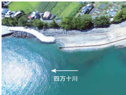
堤防の基礎となる部分を施工し…