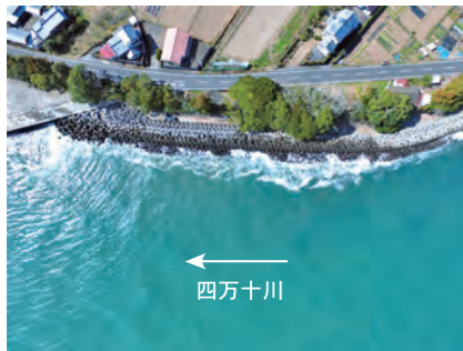
工事着手前の初崎地区

国土交通省中村河川国道事務所は、堤防がなかった四万十市初崎地区の堤防工事に平成29年度から本格的に着手しました。洪水や高潮、南海トラフ巨大地震発生時に想定される津波から地域を守るため、工事を進めています。