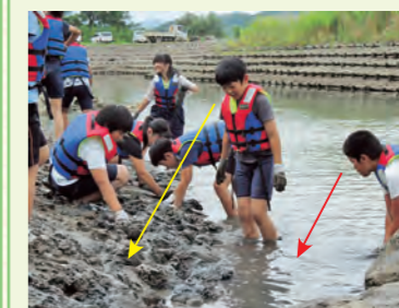
子どもたちの視線の先には…