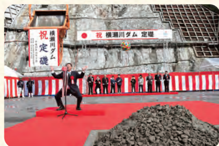
定礎を祝って万歳三唱