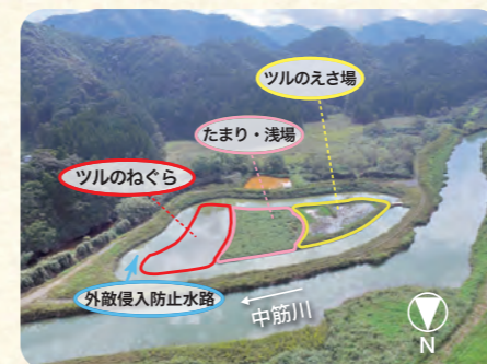
間箇所に整備した湿地

このような取り組みを行ってきた中筋川流域でツル類が越冬したことは、10年以上にわたる官民協働の取り組みの成果といえると思います。