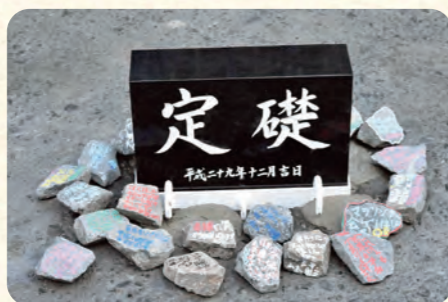
メモリアルストーン