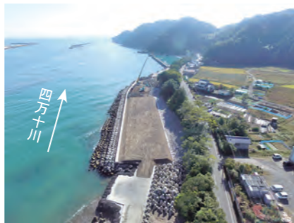
徐々に高さを上げていきます