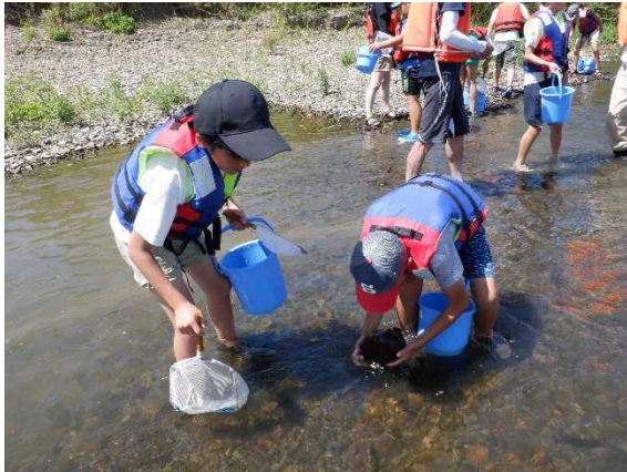
水生生物の採取状況