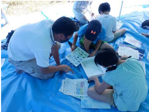
水生生物調査状況