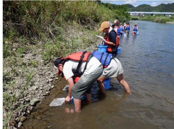
水生生物の採取状況