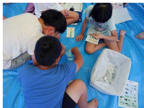
水質調査(パックテスト)実施状況