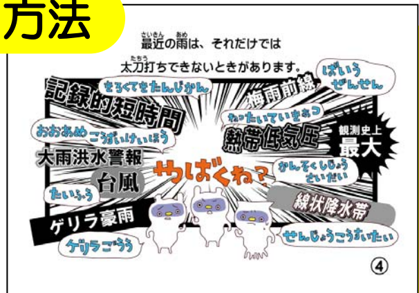
▲最近よく聞くキーワードが登場