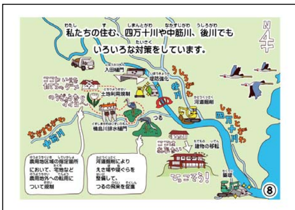
▲身近な川での対策を学ぶ