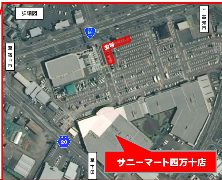
国土地理院撮影の空中写真を加工して作成