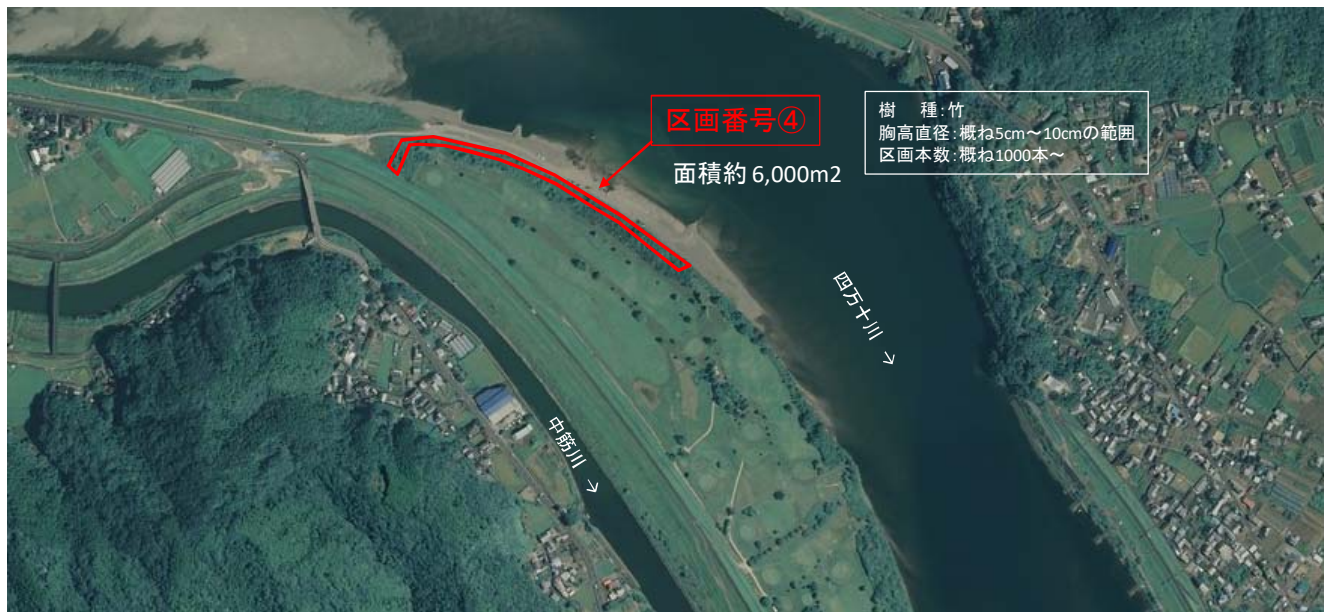
国土地理院図(電子国土Web)をもとに作成