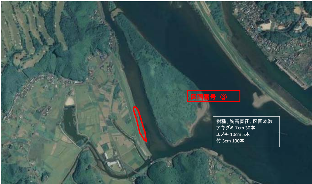
国土地理院図(電子国土Web)をもとに作成