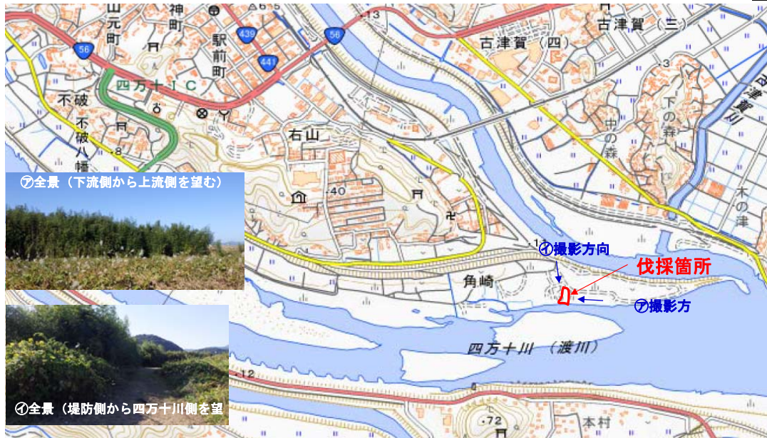
国土地理院図(電子国土Web)をもとに作成