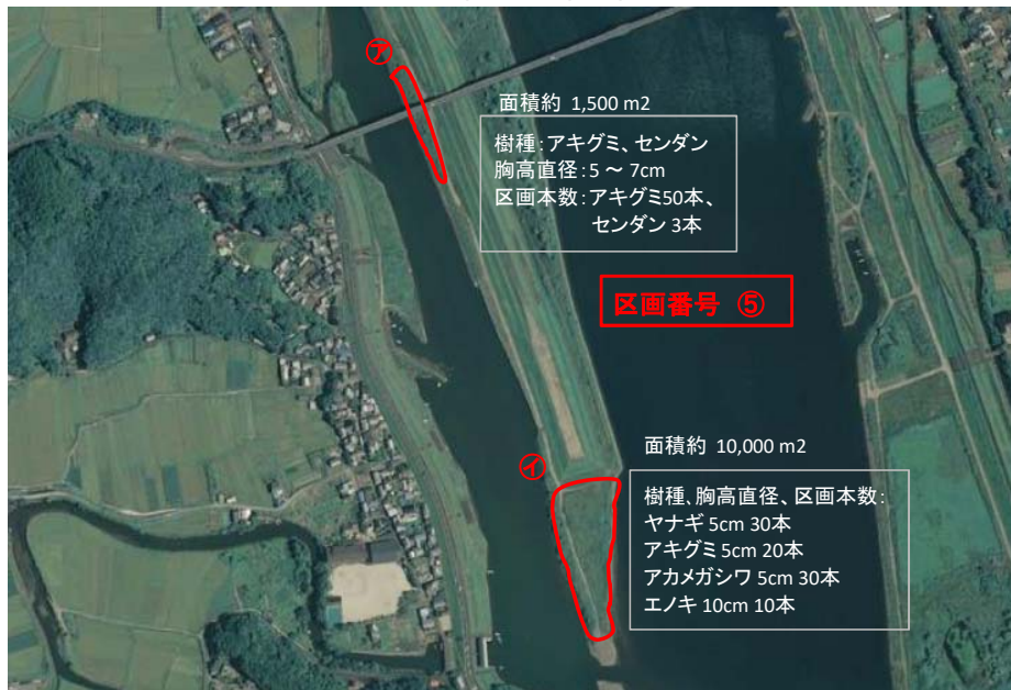
国土地理院図(電子国土Web)をもとに作成