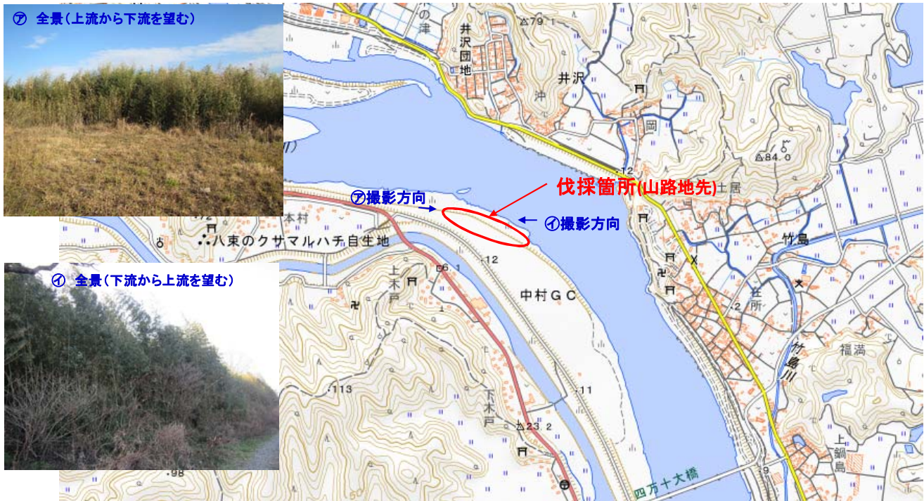
国土地理院図(電子国土Web)をもとに作成