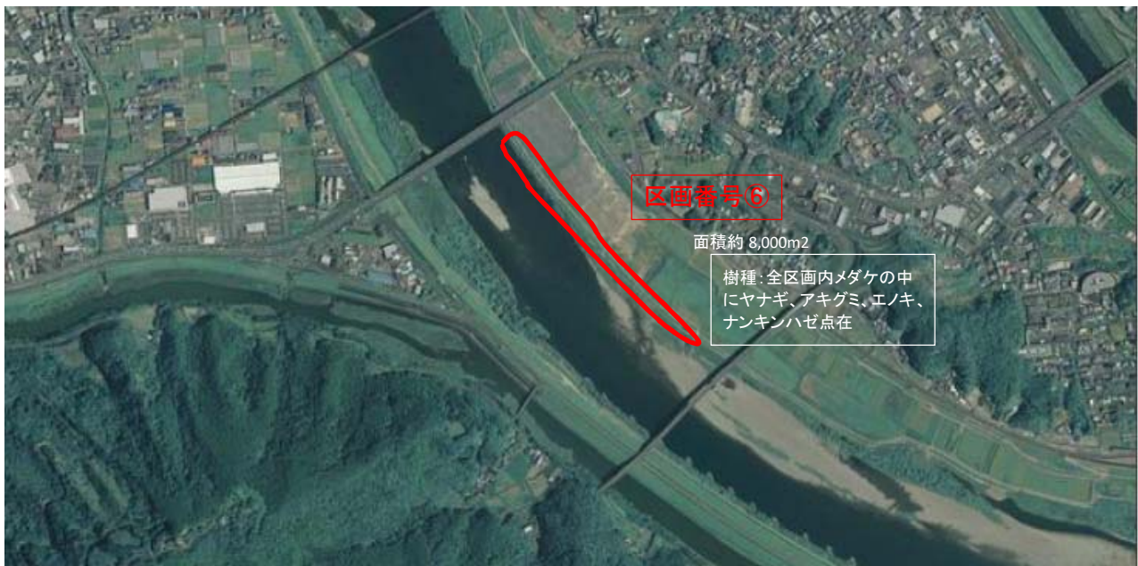
国土地理院図(電子国土Web)をもとに作成