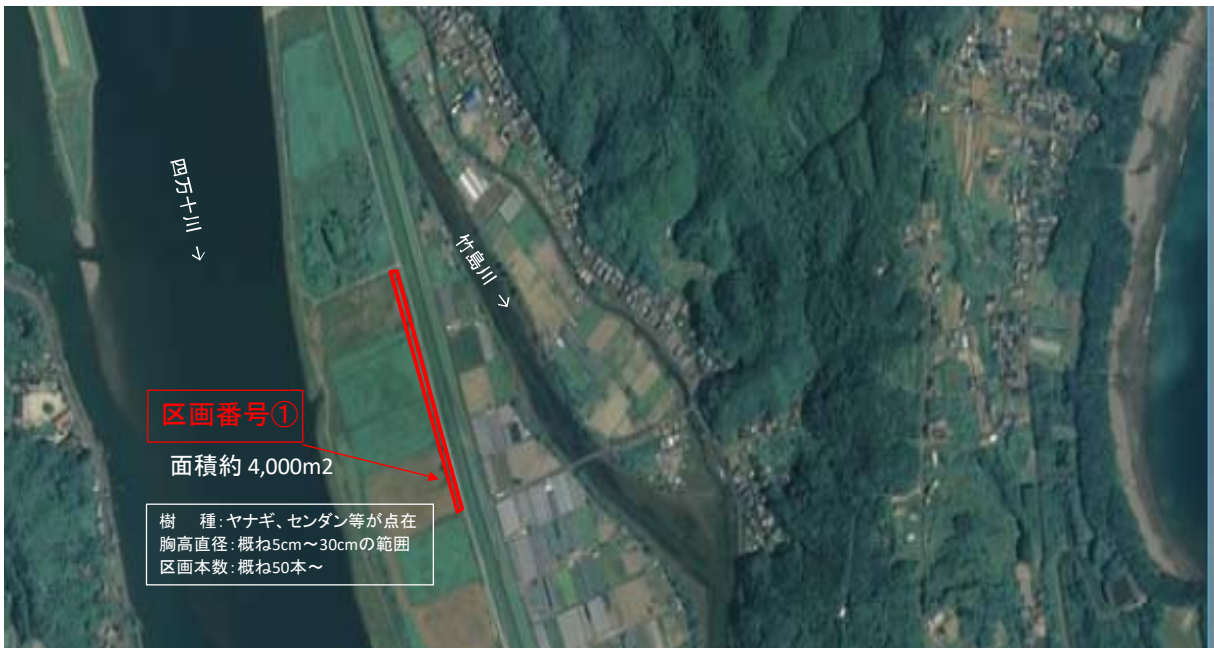
国土地理院図(電子国土Web)をもとに作成