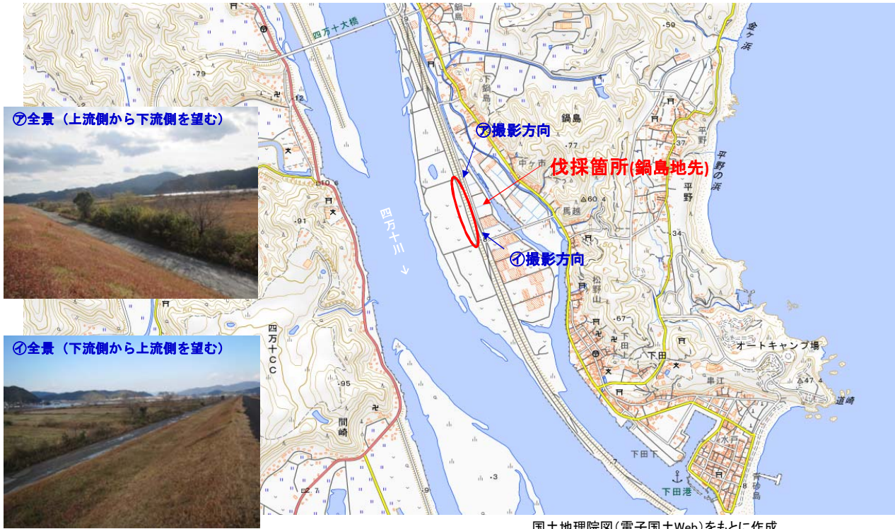
国土地理院図(電子国土Web)をもとに作成