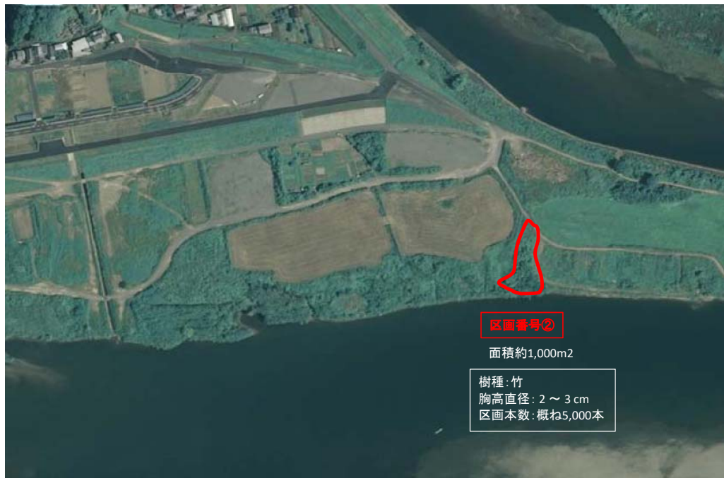
国土地理院図(電子国土Web)をもとに作成