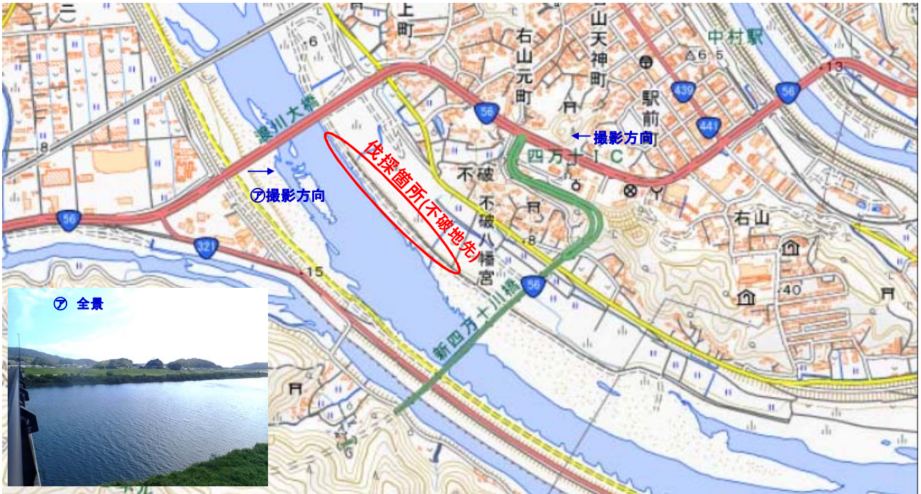
国土地理院図(電子国土Web)をもとに作成