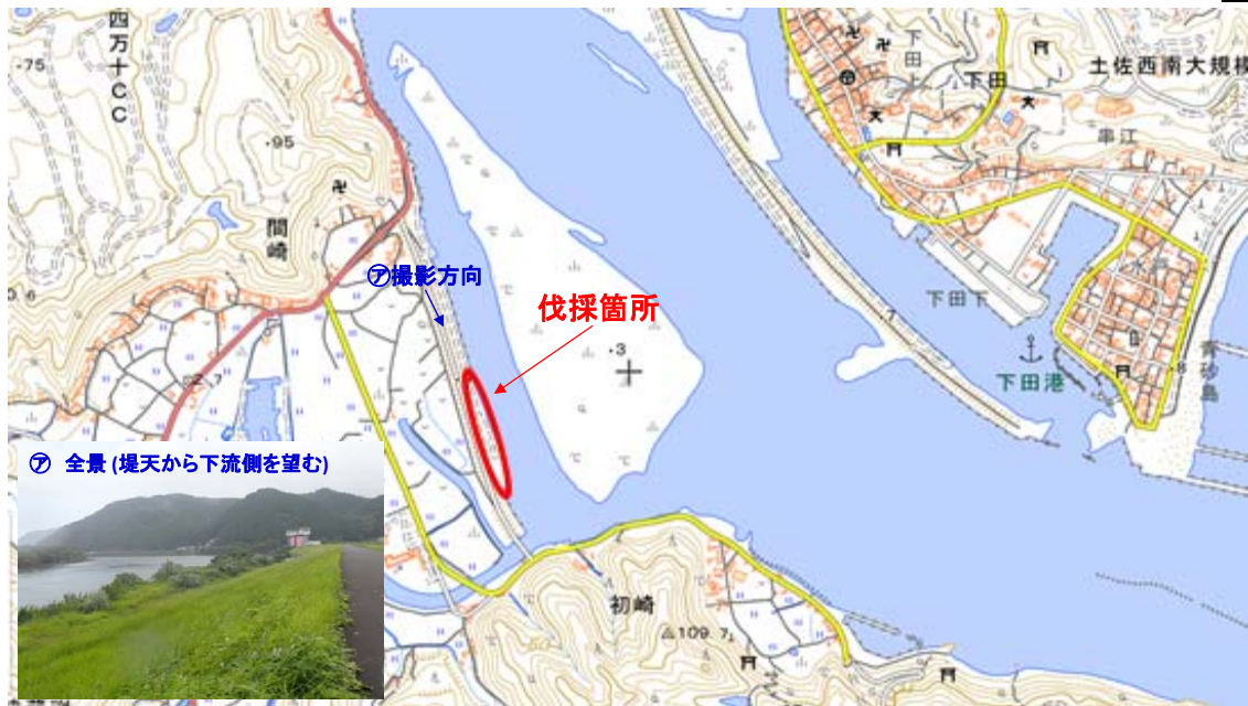
国土地理院図(電子国土Web)をもとに作成