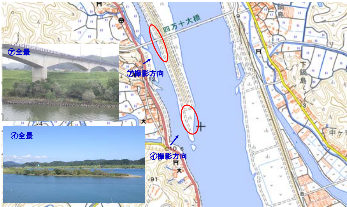
国土地理院図(電子国土Web)をもとに作成