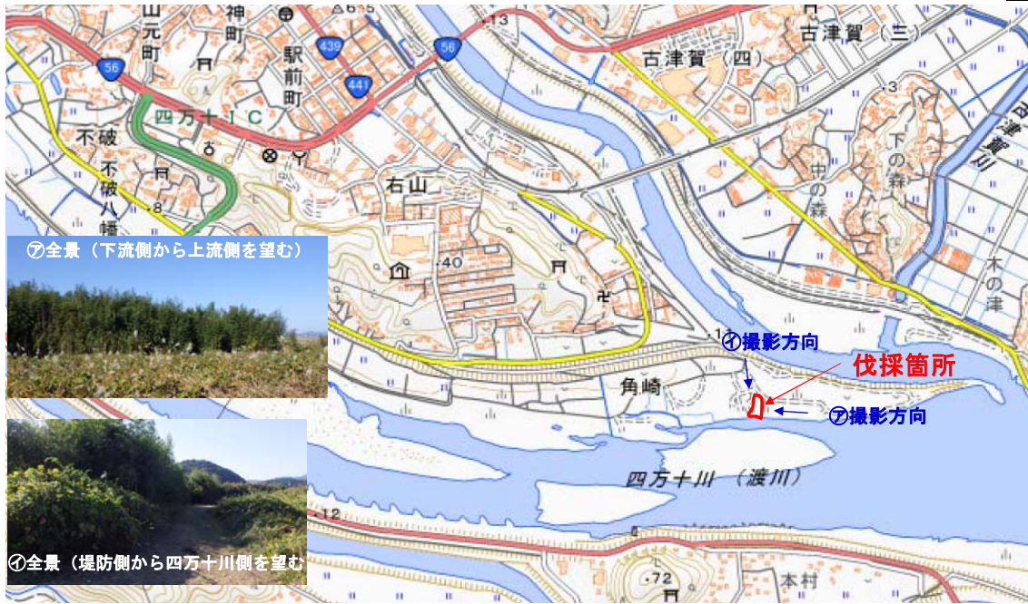
国土地理院図(電子国土Web)をもとに作成