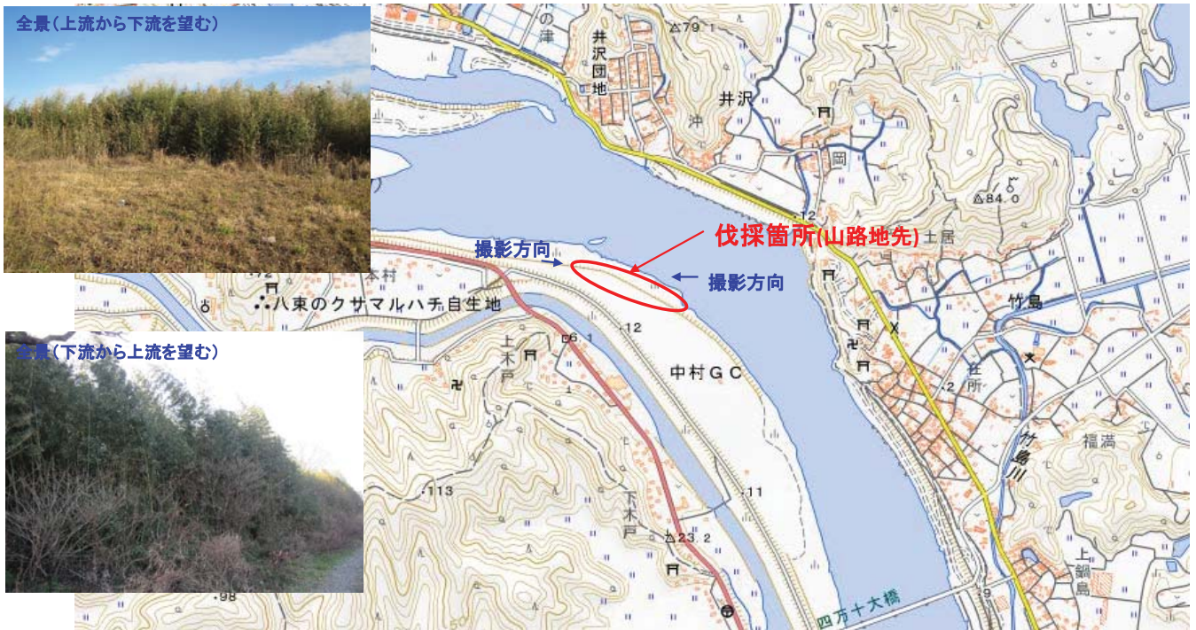
国土地理院図(電子国土Web)をもとに作成