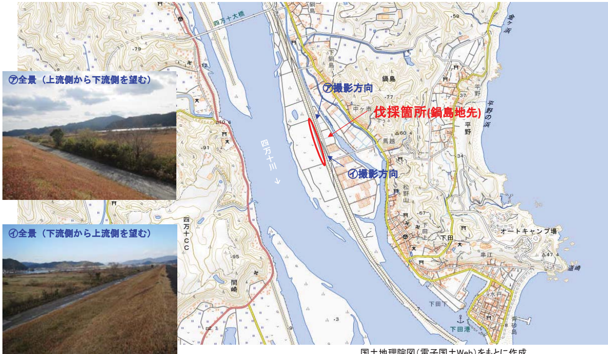
国土地理院図(電子国土Web)をもとに作成