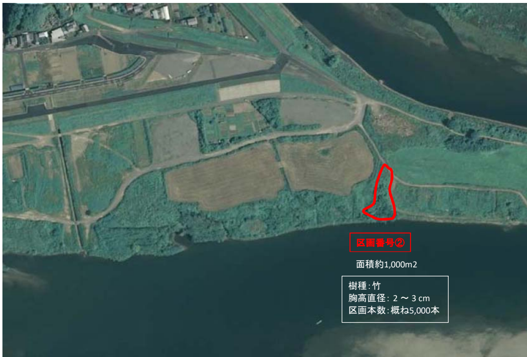
国土地理院図(電子国土Web)をもとに作成