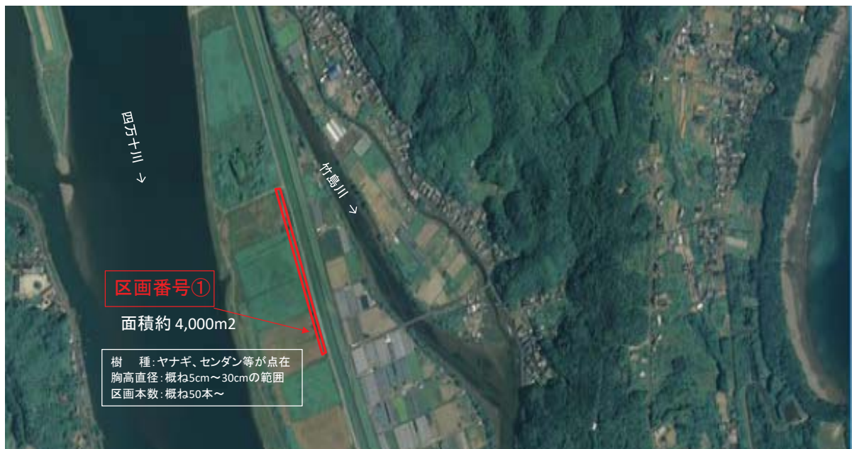
国土地理院図(電子国土Web)をもとに作成