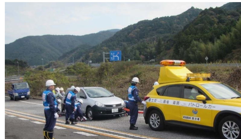
放置車両移動訓練状況(H29.11)