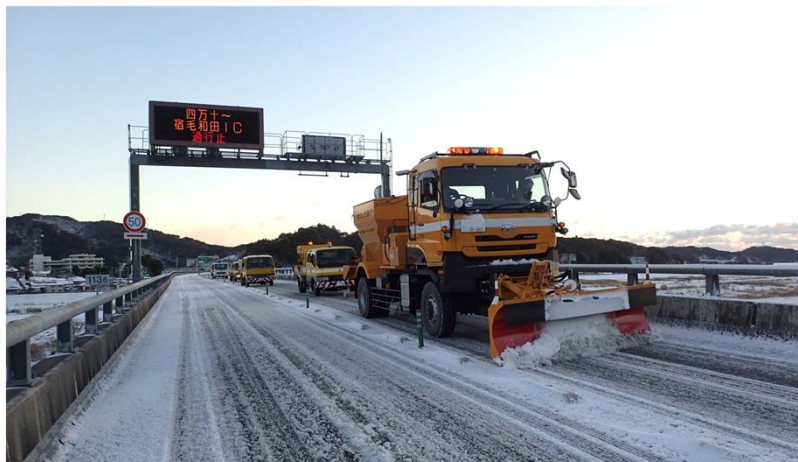
中村宿毛道路の除雪状況(R2.12)