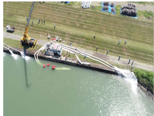
(写真: 令和3年6月1日四万十川訓練状況)