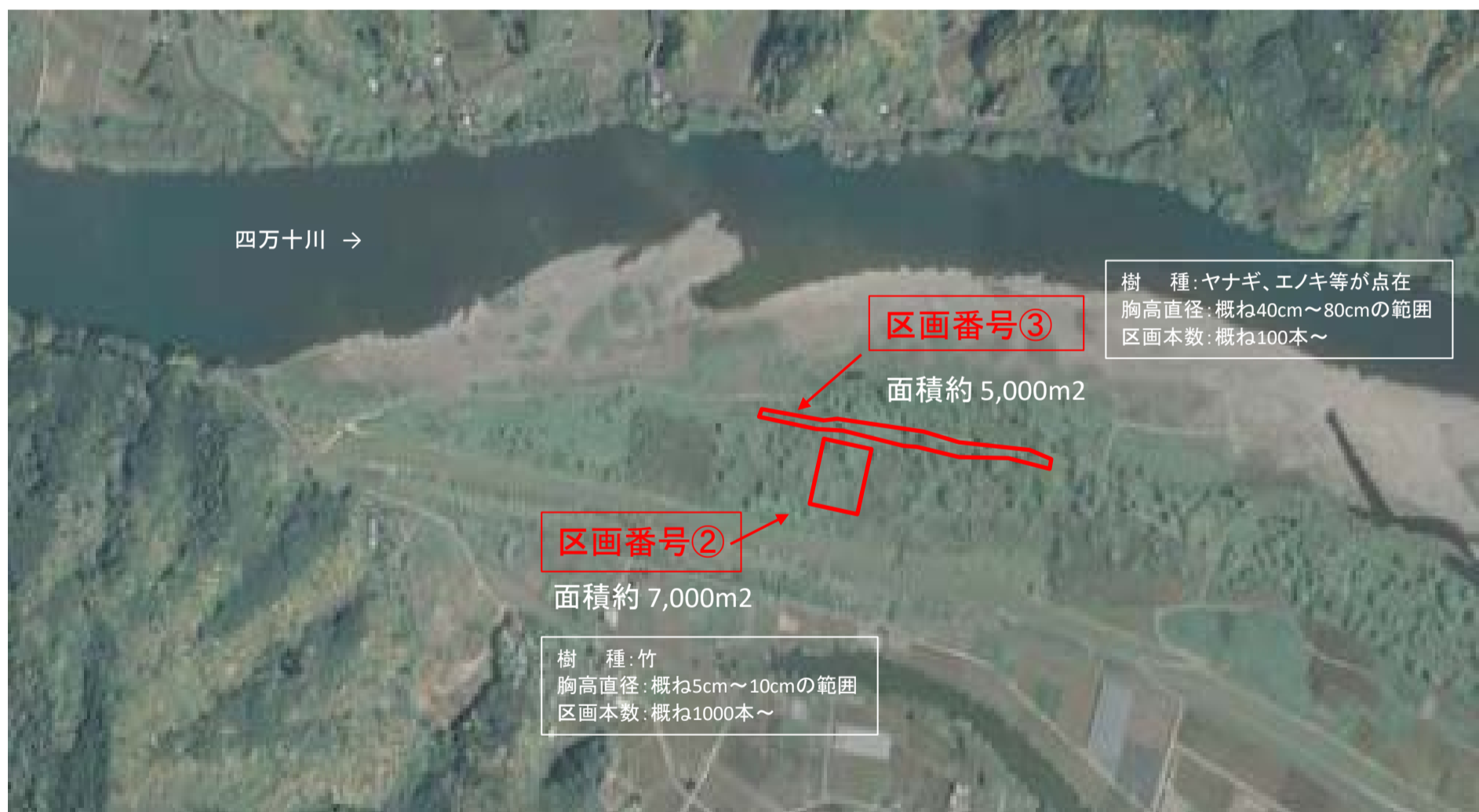
国土地理院図(電子国土Web)をもとに作成