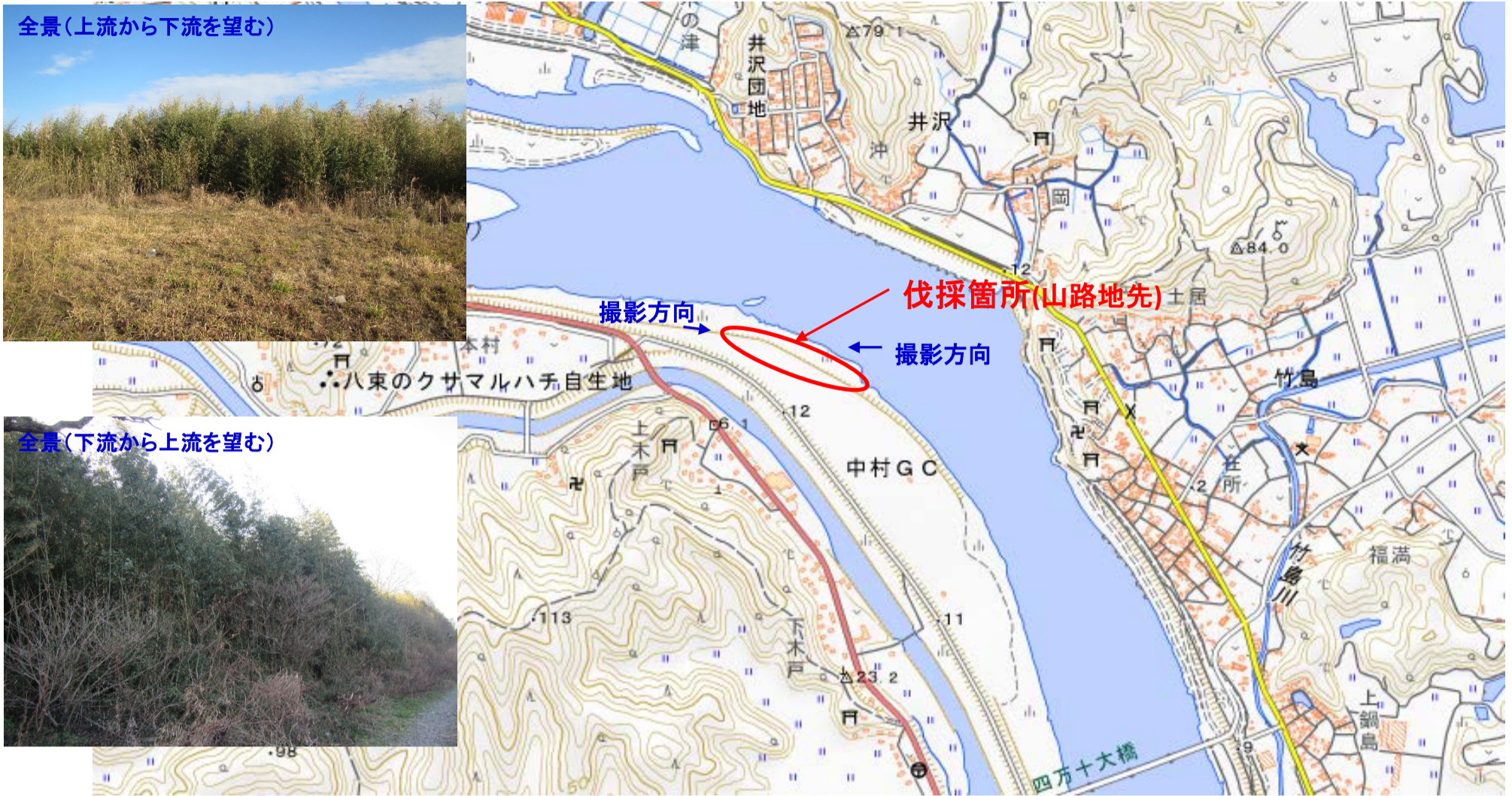
国土地理院図(電子国土Web)をもとに作成