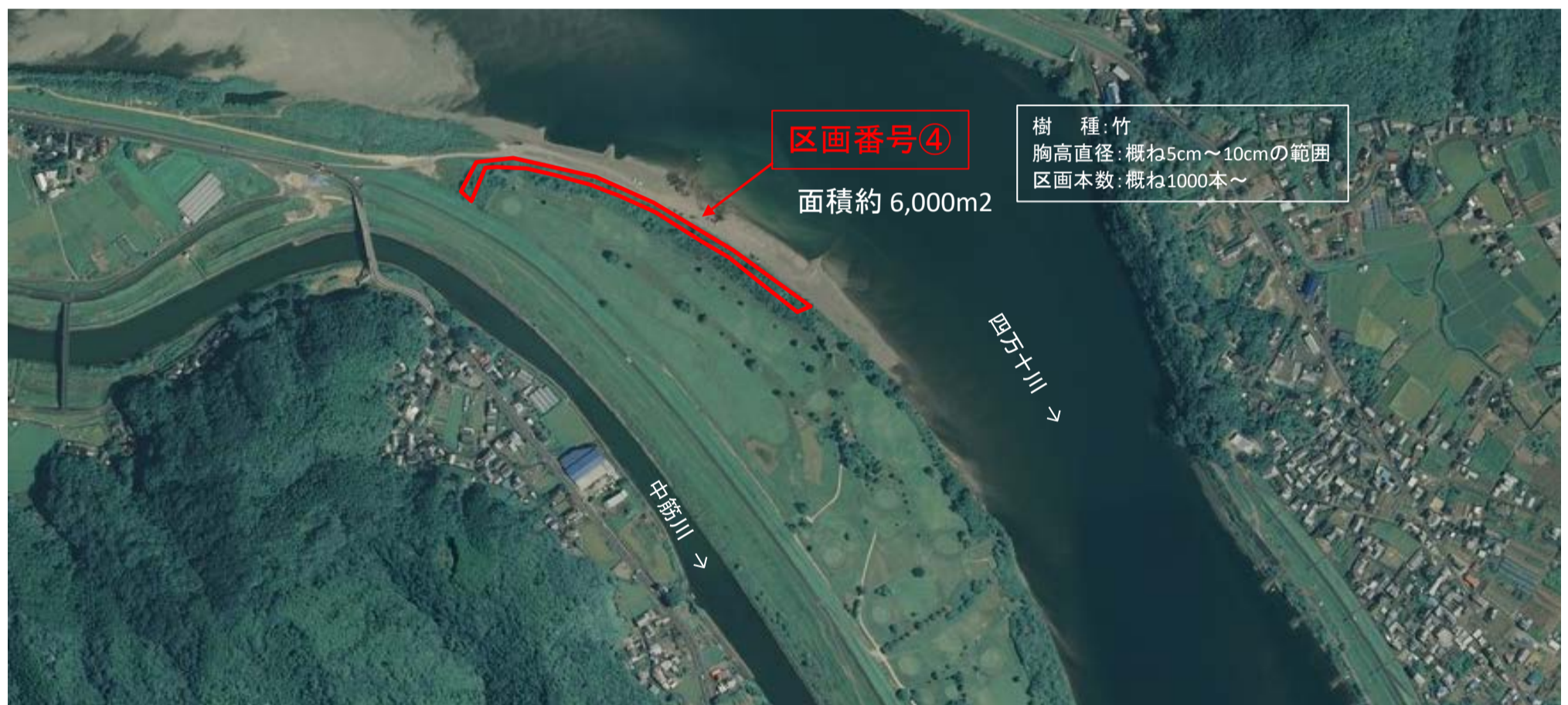
国土地理院図(電子国土Web)をもとに作成