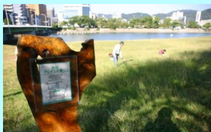
市民団体による看板設置事例（太田川）