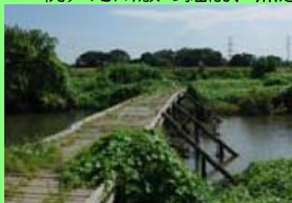
ピオトープの整備