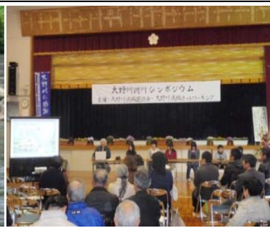
シンポジウムの開催