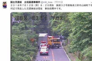
平成30年7月12日 国道32号徳島県三好市 山城町事故状況