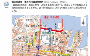
平成30年8月23日 国道30号香川県高松市 玉藻町通行止め状況