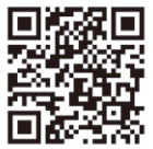
徳島河川国道事務所 tokushima