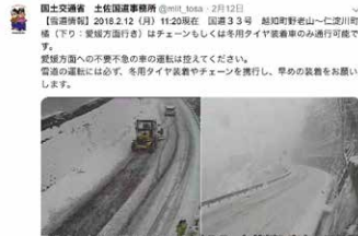
平成30年2月12日 国道33号高知県仁淀川町 降雪状況