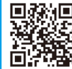
中村河川国道事務所 nakamura