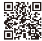
松山河川国道事務所 matukakoku