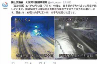
平成30年2月12日 国道56号愛媛県喜多郡 内子町降雪状況