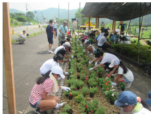
猛暑のなか、一生懸命花を植える児童達