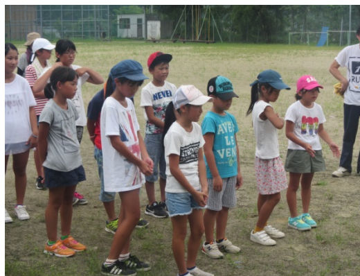
植栽の感想を発表する児童

児童たちは、猛暑の中、汗をいっぱいかきながらの作業のあと、 ・通学でいつも通っているところなので、花を植えてきれいになってうれしいです。 ・お遍路さんなどが気持ちよく休んでくれたらうれしいです。 ・暑くて、疲れたけど花できれいになってうれしいです。 等の感想を参加児童全員が話してくれました。お疲れ様でした。