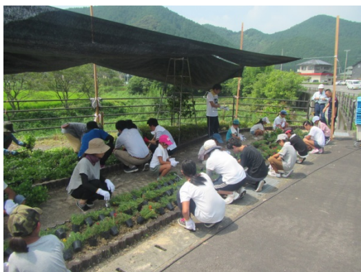
作業開始 暑さに負けず頑張ろう