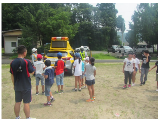
道路パトロール車って、どうなっているの？