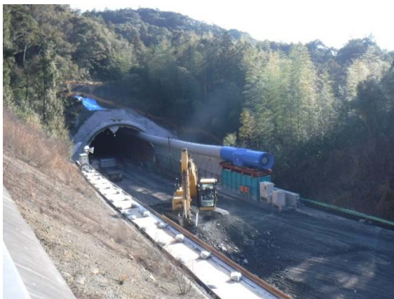
〈トンネル坑口(宇和島市側)〉