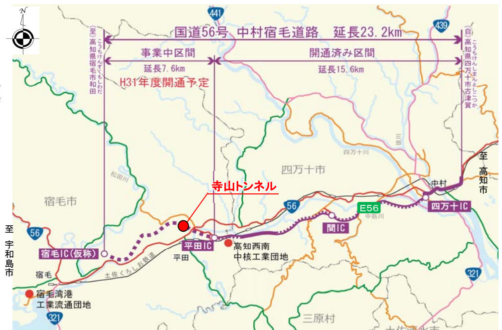
この地図は一般財団法人日本デジタル道路地図協会のデータベースを加工し作成したものである