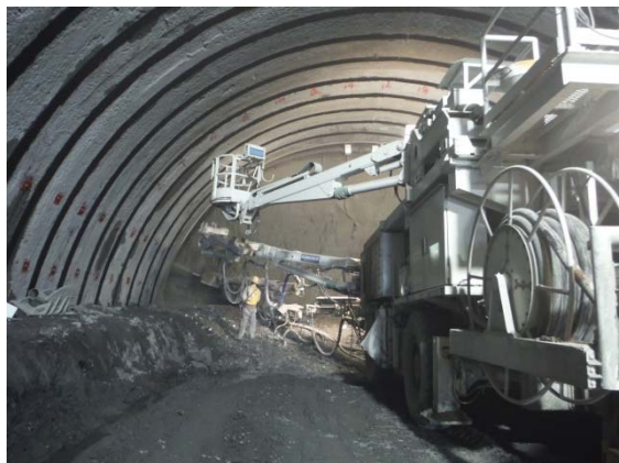
〈吹付けコンクリート施工状況〉