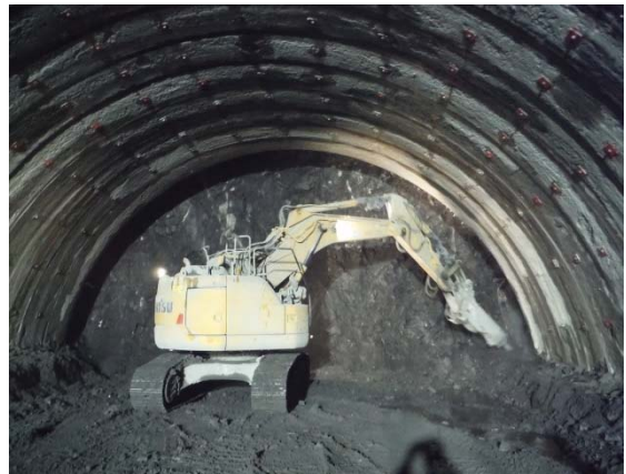
〈トンネル掘削機械による掘削状況〉