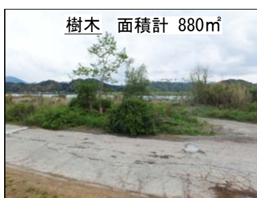
樹木 面積計 880㎡