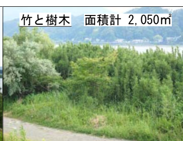
竹と樹木 面積計 2,050㎡