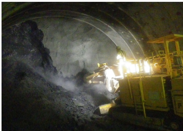
〈トンネル掘削機械による掘削状況〉