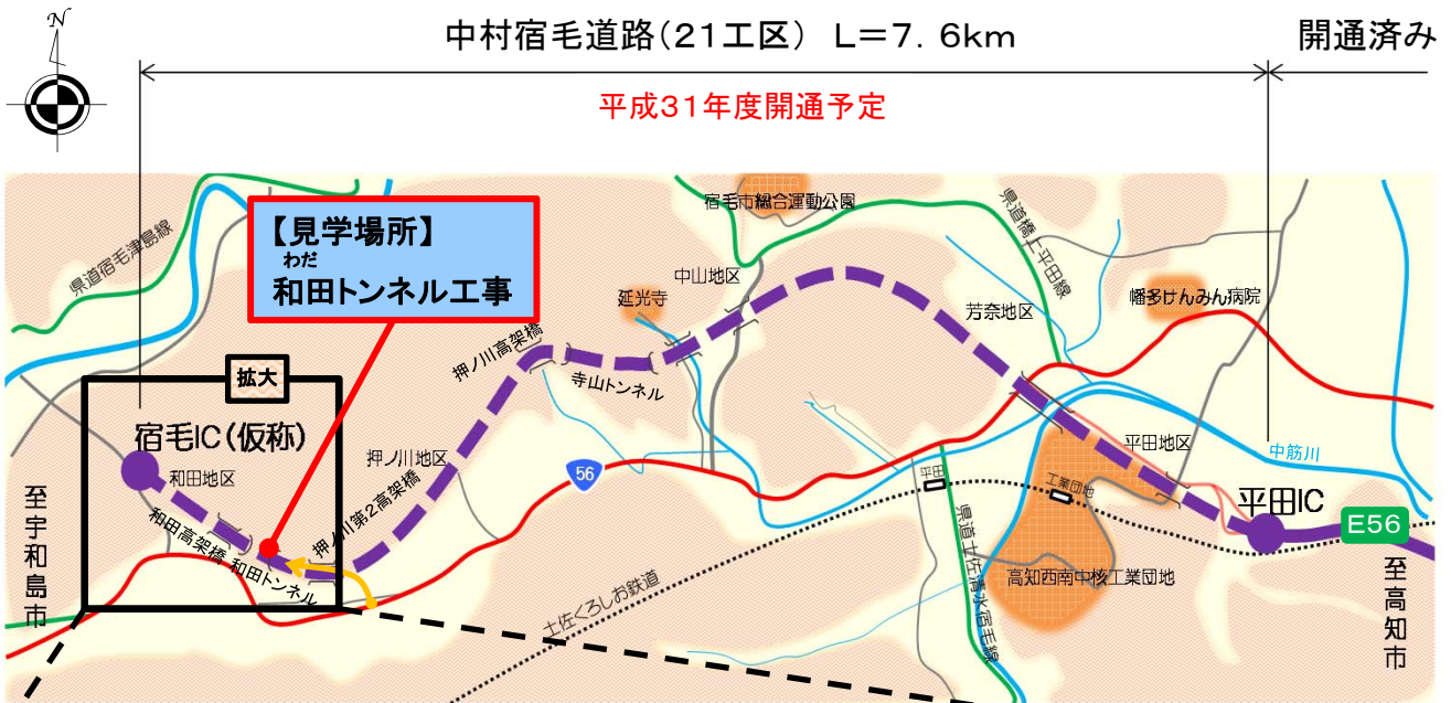
この地図は地理院の地理院地図を加工し作成したものである