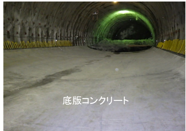
〈トンネル坑内(底版コンクリート施工済区間)〉