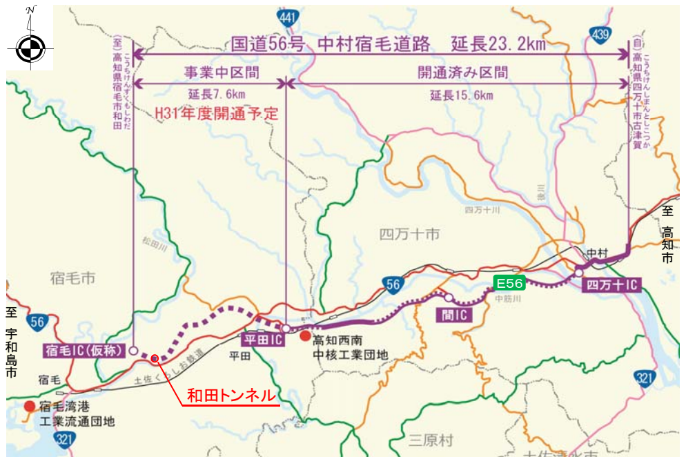
この地図は一般財団法人日本デジタル道路地図協会のデータベースを加工し作成したものである