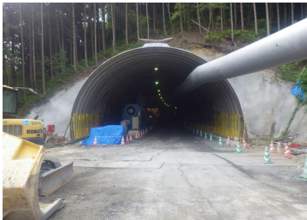
〈トンネル坑口(四万十市側)〉