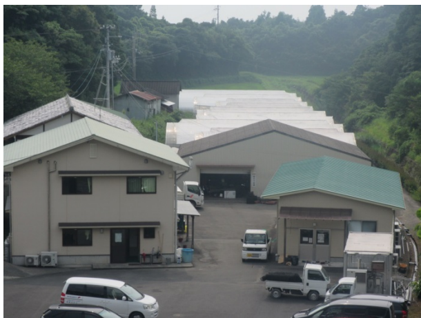
大方生華園 花卉生産施設

『大方生華園』の皆さんも、ボランティア・サポート・プログラムに参加し、日頃より国道の美化活動等に取り組んで頂いております。