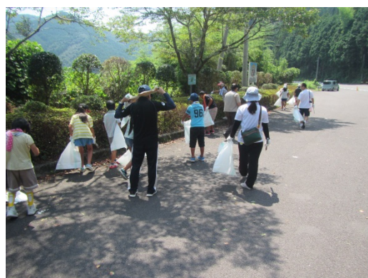
猛暑のなか、頑張る児童達