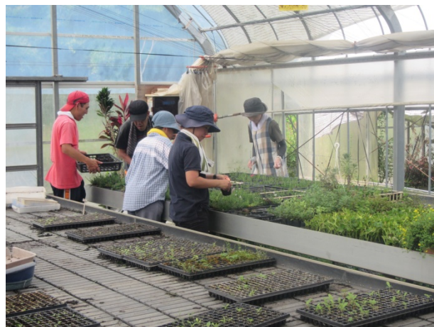
入園者等の作業風景