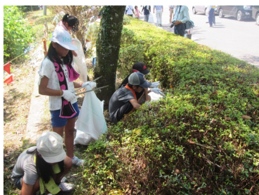
猛暑のなか、頑張る児童達