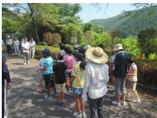
暑い中ですが、体調に気をつけて頑張ろう