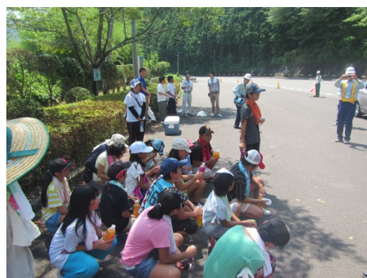
道路清掃の感想を発表する児童

児童たちは、猛暑の中、汗をいっぱいかきながらの作業のあと、 ・道路にこんなにたくさんゴミが落ちていると思わなかった。 ・きれいになって良かったです。 ・前年よりは、ごみが少なくて良かったです。 等の感想を参加児童全員が話してくれました。お疲れ様でした。