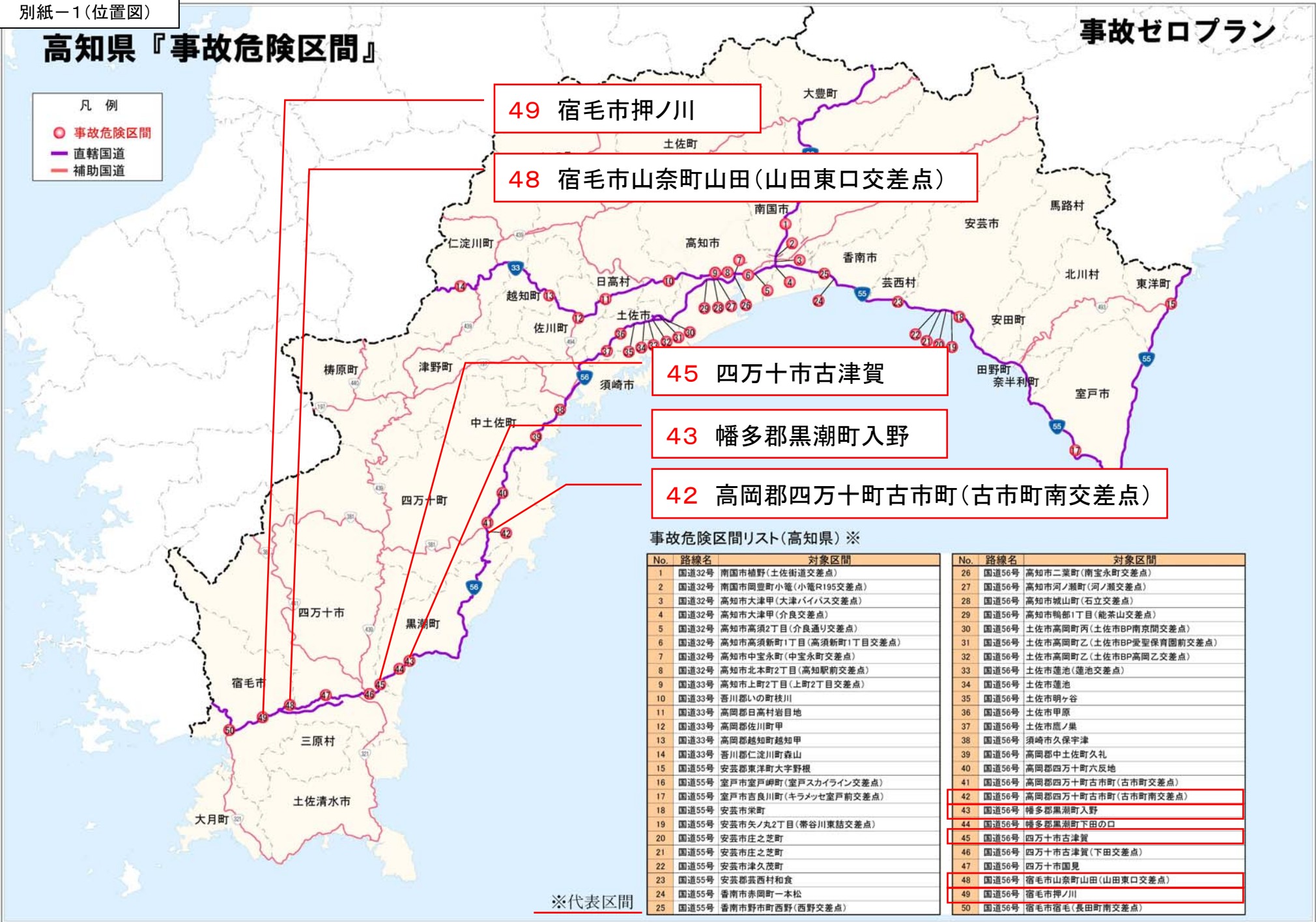
事故危険区間リスト(高知県) ※