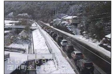
平成22年12月31日 四万十町金上野

高知県西部の国道56号でも、昨年の積雪の際に、ノーマルタイヤにて走行の末、上り坂を上れなくなったことが原因で、約2.5kmの渋滞が発生しました。積雪・凍結に対する準備不足は重大な事故・渋滞につながる恐れがあります。（資料－1）