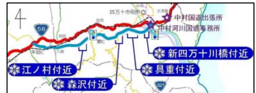
中村宿毛道路「凍結危険箇所マップ」抜粋

「凍結危険箇所マップ」は、高知県西部の国道56号において路面凍結しやすい箇所を示したものです。他の箇所でも路面凍結が起こる場合があることをご理解下さい。積雪時は、すべての橋梁や坂道、日陰、カーブ等において特に注意する必要があります。（資料－2）