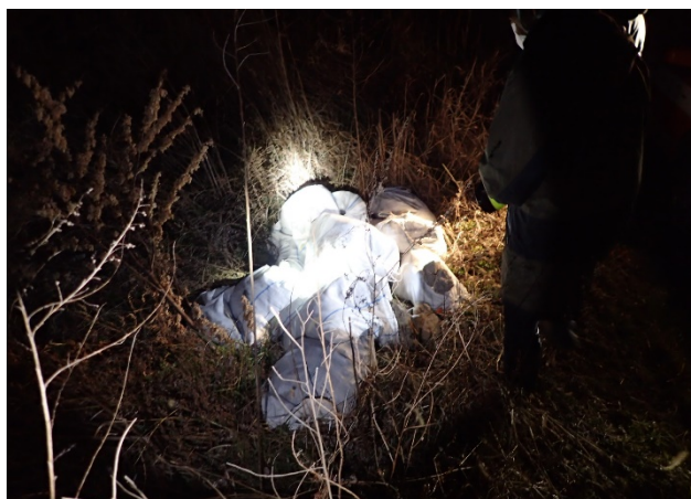
車が乗り込みやすいところや茂みで見えにくいところは、ゴミが多く確認されました。