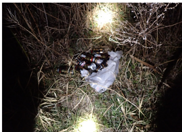
ゴミの種類は家庭ゴミや粗大ゴミ等、様々です。