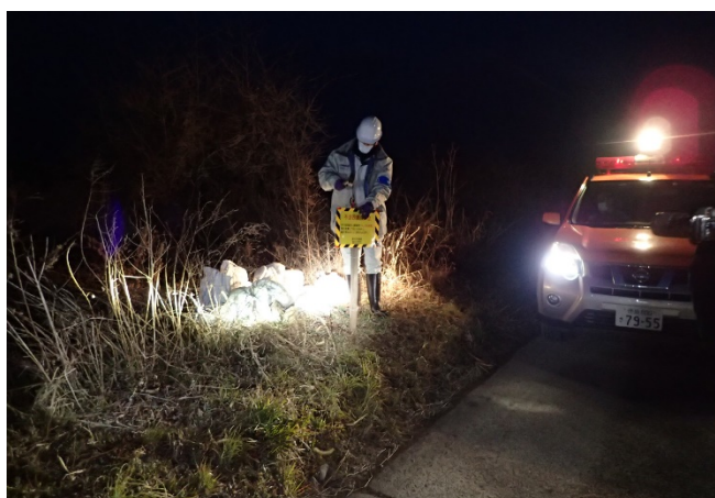
不法投棄の多いところには、禁止看板を設置しています。