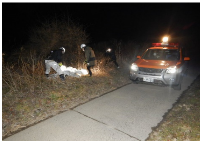
国土交通省 那賀川河川事務所のパトロール。

国土交通省 那賀川河川事務所と徳島県では不法投棄防止の取り組みの一環として、2月17日に夜間合同パトロールを行いました。那賀川河川事務所は那賀川、桑野川、派川那賀川の管理する区間。また徳島県は南部総合県民局管内の不法投棄重点箇所をパトロールしました。