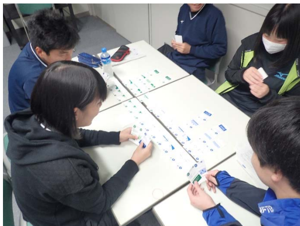
防災カードゲーム