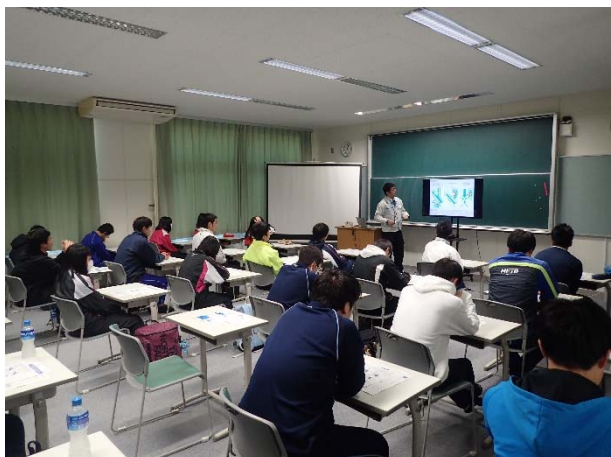
那賀川に関する座学