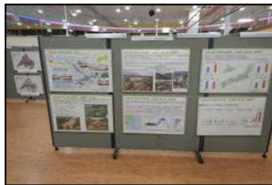
パネル展示イメージ(昨年度)