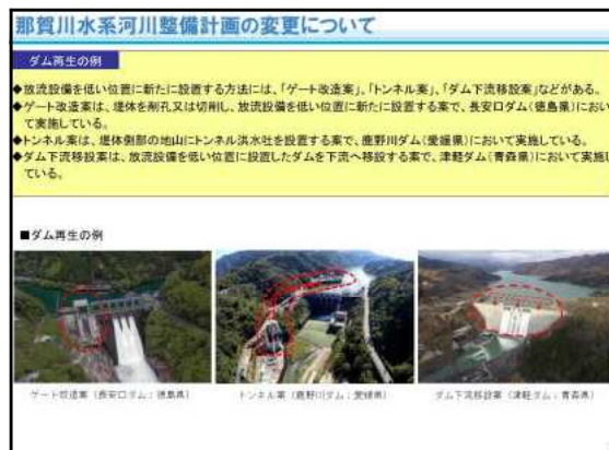
【小見野々ダム再生案の説明】