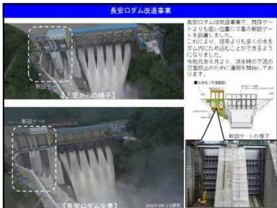
【長安ロダム新設ゲートの説明】