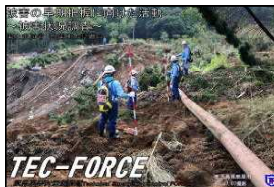
TEC-FORCE(緊急災害対策派遣隊)