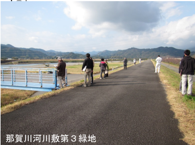
那賀川河川敷第3緑地