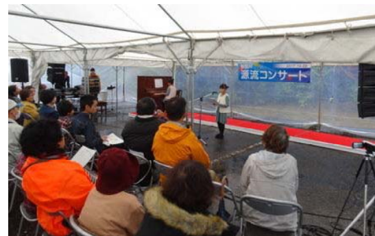
下流の小さなピアニストたちによる歌とピアノ演奏