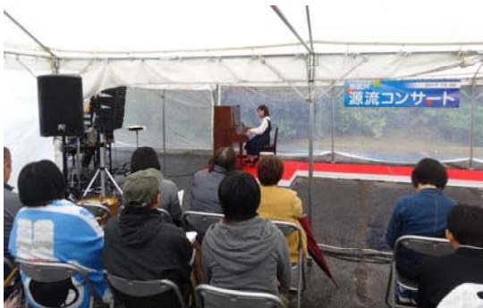
上流の小さなピアニストたちによるピアノ演奏