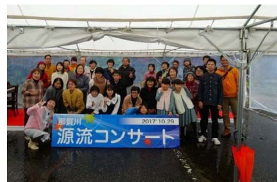
参加者のみなさんと集合写真♪

悪天候の中、出演者の一生懸命な演奏や歌声により、会場全体は暖かい雰囲気となり、素晴らしいコンサートとなりました。