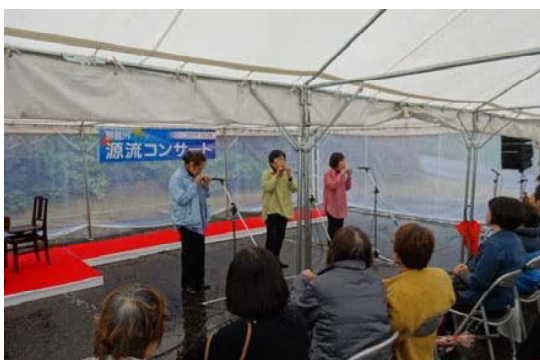
アマポーラのおカリナ演奏