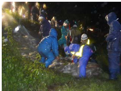
平成 15 年台風 10 号における水防活動