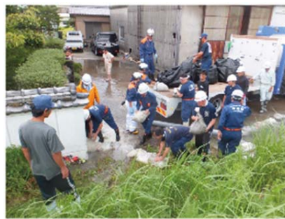
平成 26 年台風 11 号における水防活動

※本施策は、四国圏広域地方計画の広域プロジェクト「南海トラフ地震を始めとする大規模自然災害等への「支国」防災力向上プロジェクト」の取り組みに該当します。