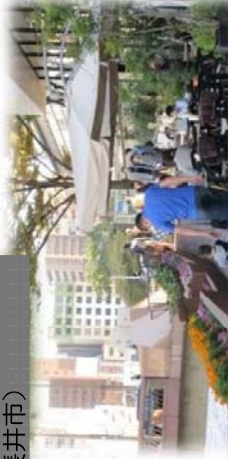
水辺のオープンカフェ (那珂川/福岡市)