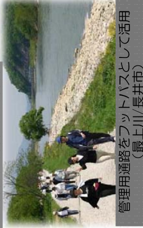
管理用通路をフットパスとして活用 (最上川/長井市)