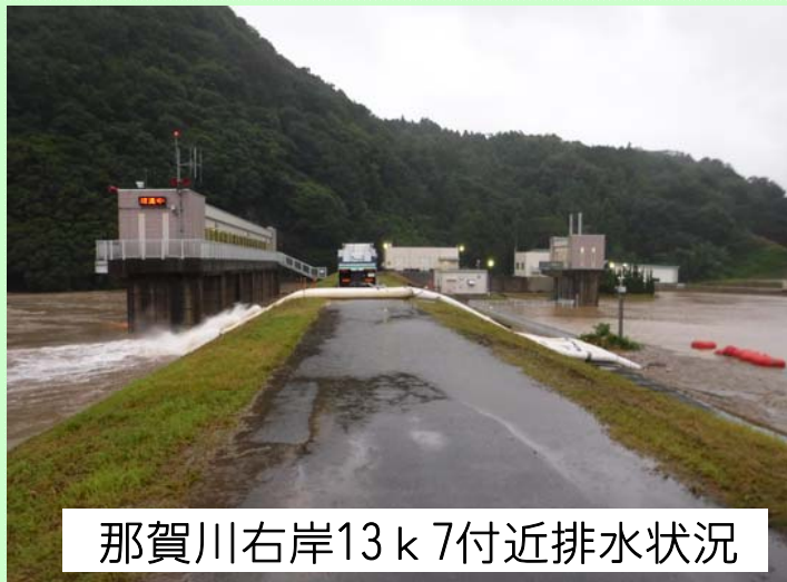
那賀川右岸13k7付近排水状況