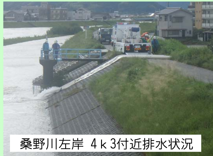
桑野川左岸 4k3付近排水状況