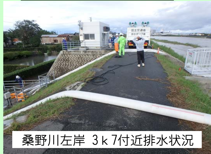
桑野川左岸 3k7付近排水状況