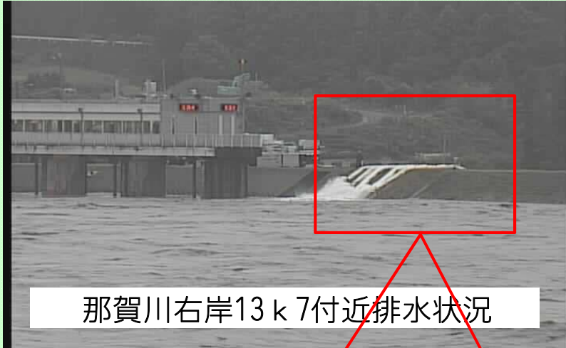
那賀川右岸13k7付近排水状況