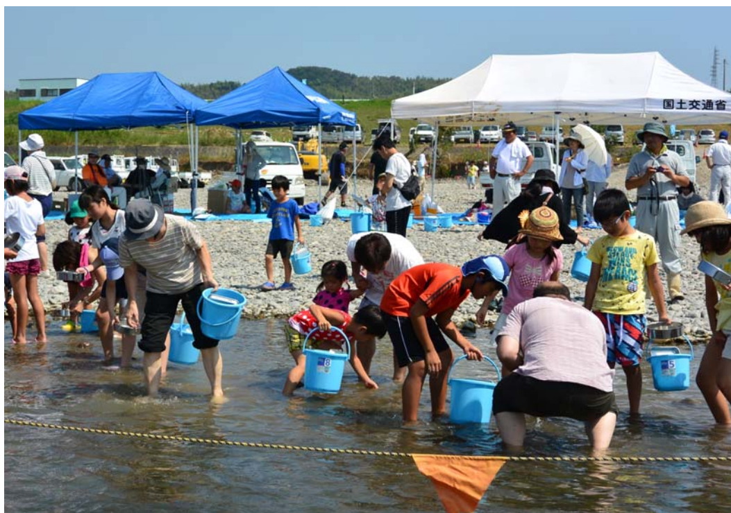
水生生物による水質調査の実施状況 ※H27は約100名の参加がありました。