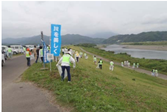
阿南市上大野町付近の活動風景

※四国地方整備局那賀川河川事務所HP ( http://www.skr.mlit.go.jp/nakagawa/ ) もご覧ください。