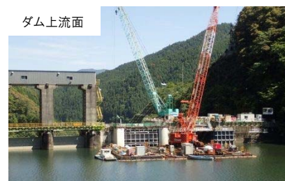
長安ロダム施設改造工事の状況 (平成28年6月撮影)