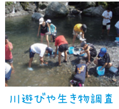
川遊びや生き物調査