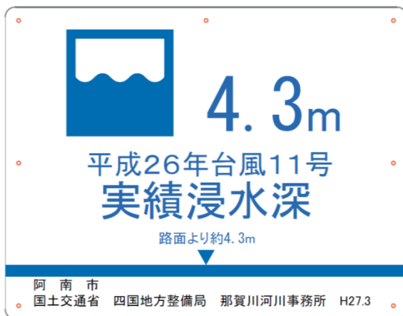
加茂谷中学校の校舎壁面用