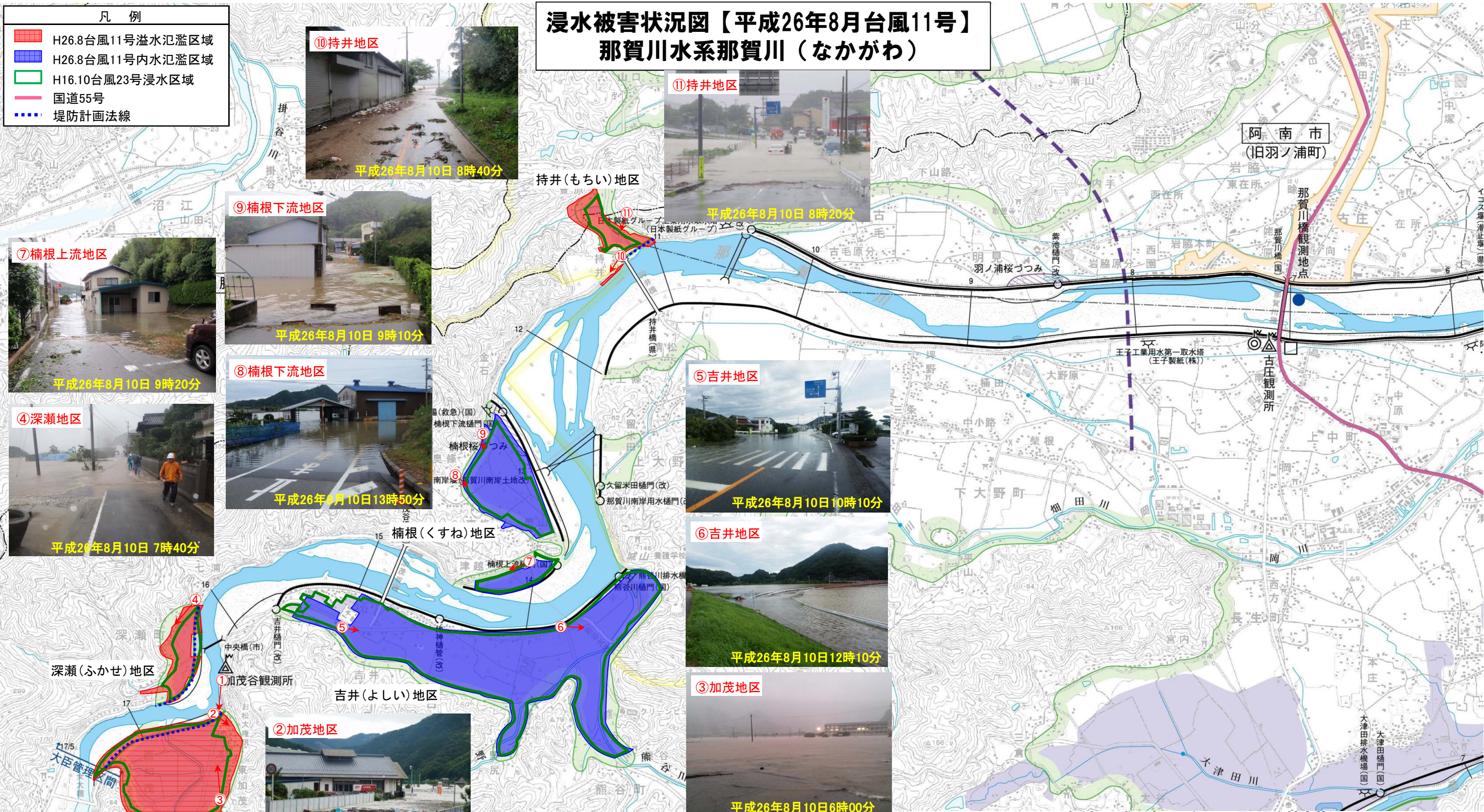
那賀川 平成26年8月台風11号 浸水被害状況