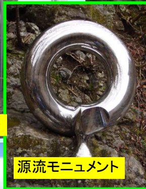
源流モニュメント