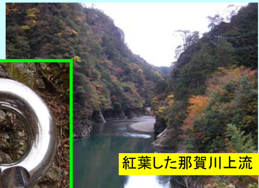
紅葉した那賀川上流