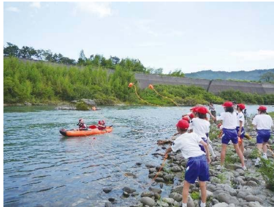
那賀町立鷺敷小 (平成21年7月13日(月))