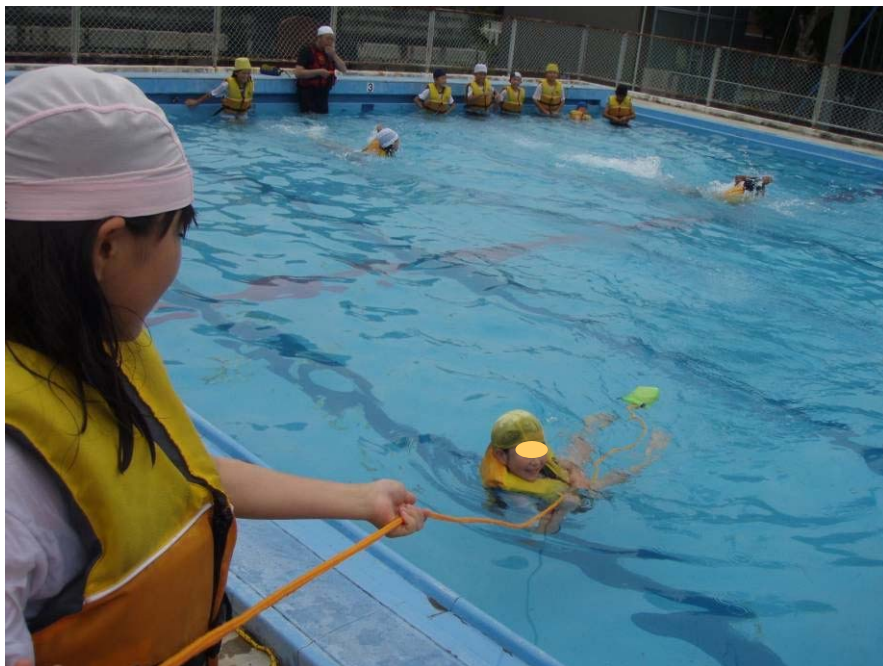
阿南市立岩脇小 (平成22年7月2日(金))