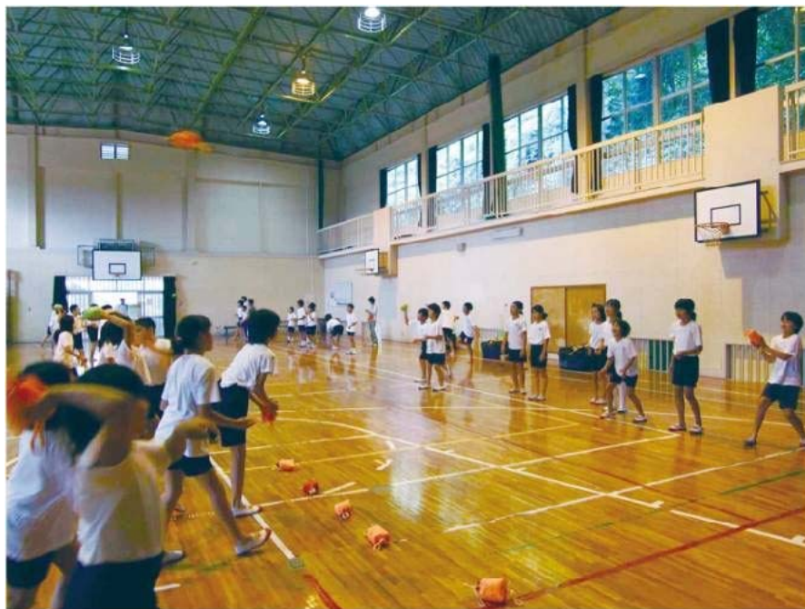
阿南市立桑野小 (平成21年7月6日(月))