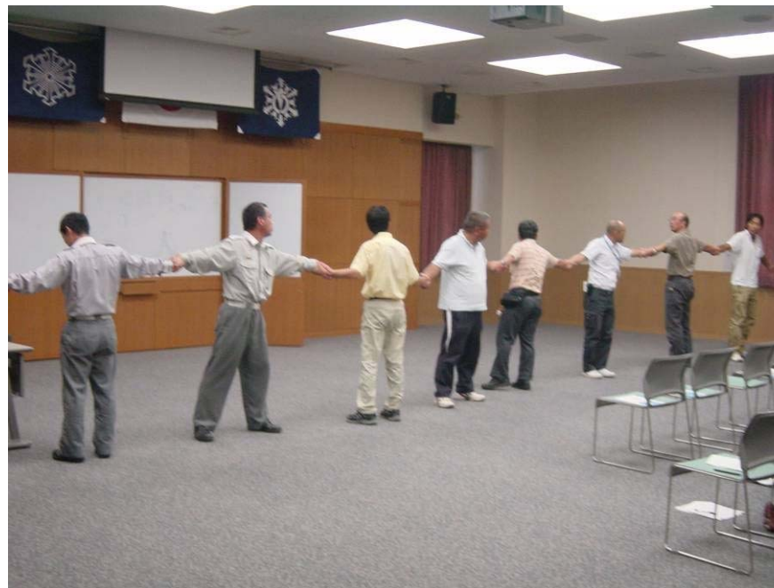
阿南市教育委員会および学校関係者 (平成22年8月9日(月))