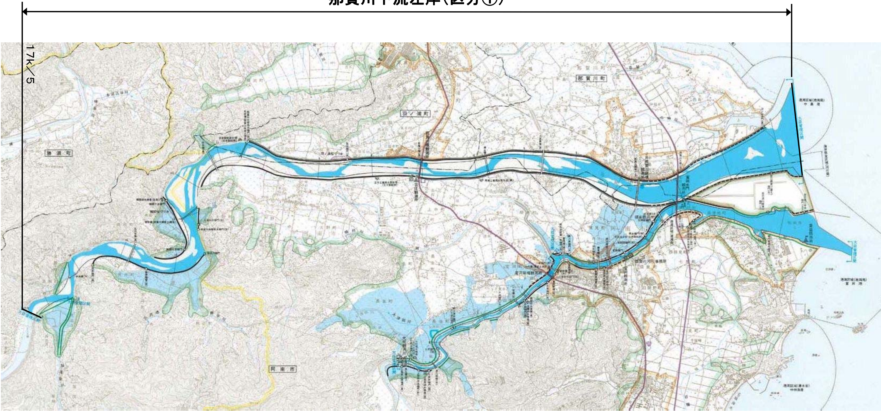
「この地図は、測量法第29条に基づく複製承認を得て、国土地理院発行の5万分の1地形図を複製したもの（平20四復、第14号）を一部転載したものである。」