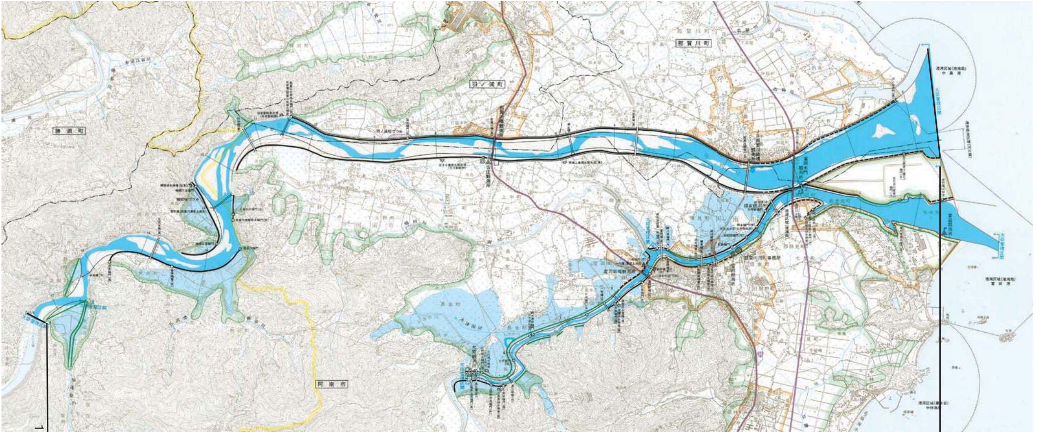
那賀川下流右岸(区分②)