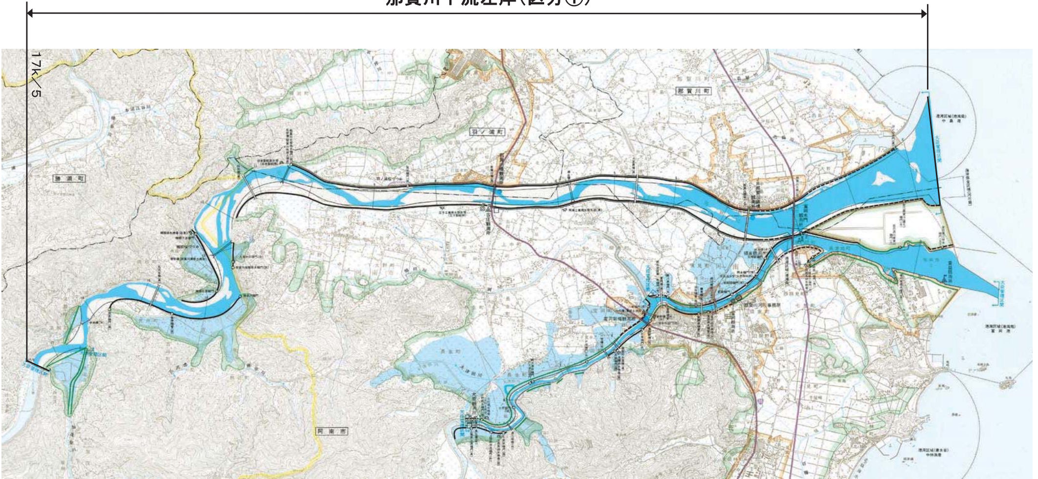
「この地図は、測量法第29条に基づく複製承認を得て、国土地理院発行の5万分の1地形図を複製したもの（平20四複、第14号）を一部転載したものである。」