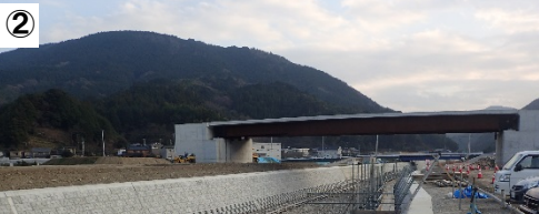
高橋下流の旧河道からの切替が完了しました。