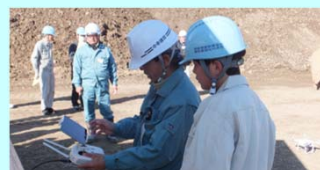
ドローン操縦の説明をうける学生