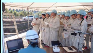
情報通信技術(ICT)の説明