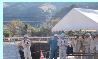
ドローン操縦体験