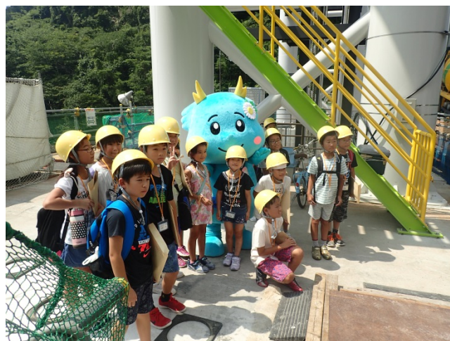
「りゅうな」との記念撮影の様子②