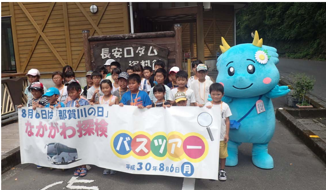
参加者全員で「りゅうな」と一緒に集合写真！

那賀川河川事務所では、今後も「那賀川の日」に開催するバスツアーなどを通して、那賀川流域の上下流交流を深めていきたいと思えます。