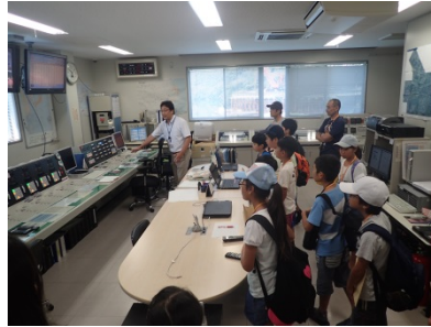
ダム操作室内の見学