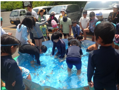
アメゴのつかみ取り

帰る前には、つかみ取り体験で取ったアメゴの塩焼きをみんなでおいしく頂きました。中には、川魚を食べるのが初めてという子供もいましたが、「おいしい」と言って何匹も食べていました。