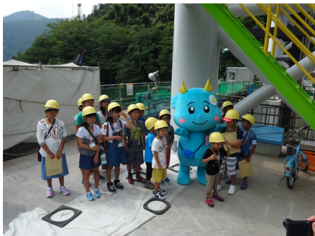
「りゅうな」との記念撮影の様子①

長安ロダムでは、ダムの操作室に入って頂き、ダムの仕組みや役割について学んで頂いた他、ダム改造事業の工事現場において、コンクリートの打設状況やクレーン作業の様子を見学して頂きました。また、ダム見学中には、昨年度誕生した那賀川のイメージキャラクターとなった「りゅうな」も来てもらい、子供達と一緒に記念撮影を行いました。