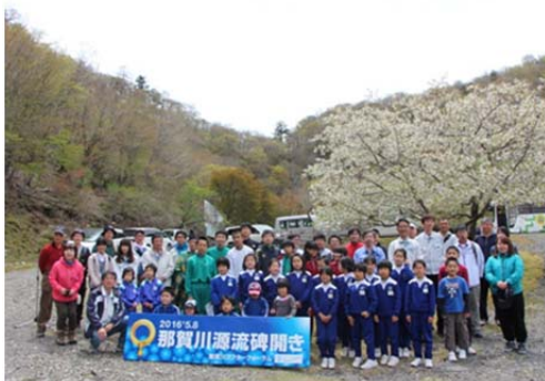
那賀川源流碑開き