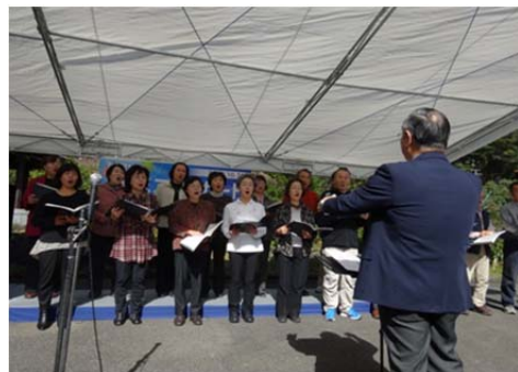
那賀川源流コンサート