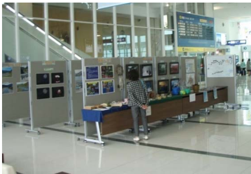
徳島阿波踊り空港 那賀川写真展