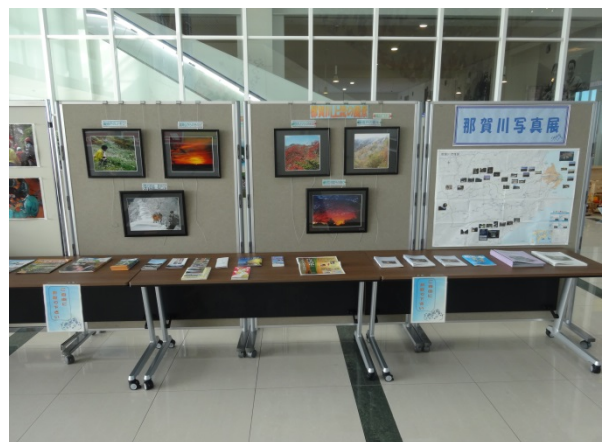
観光パンフレット

「ゆきかう那賀川推進会議」は、流域内交流の活性化、上下流連携の推進による流域振興を目指して、流域で活躍する学識者、民間団体、徳島県、阿南市、那賀町、那賀川河川事務所で平成20年3月に設立された組織です。