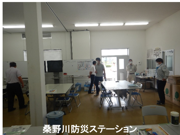
桑野川防災ステーション