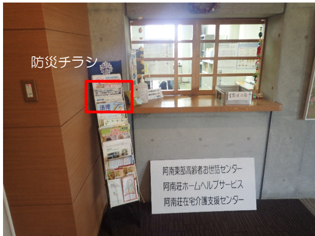
【阿南市東部高齢者お世話センター】