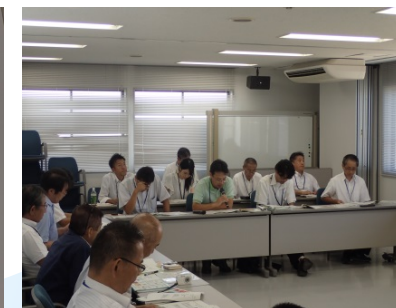
徳島南部災害情報協議会の様子