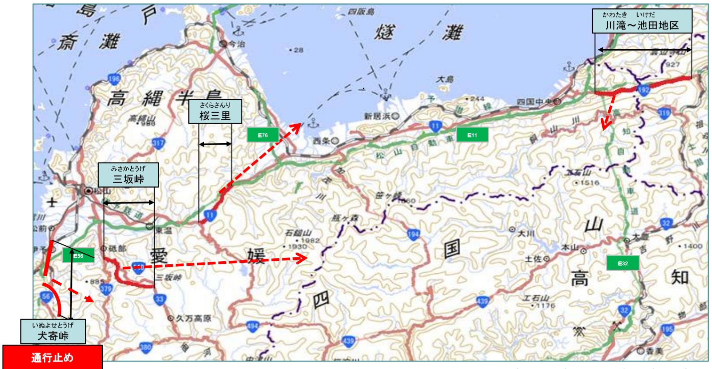
この地図は、国土地理院の地理院地図に加筆したものである。