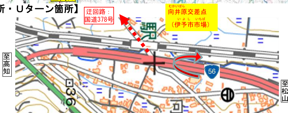
【終点部迂回箇所・Uターン箇所】