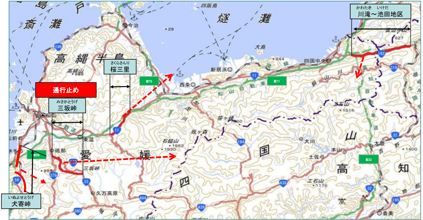
この地図は、国土地理院の地理院地図に加筆したものである。