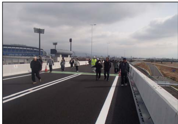
ウォーキング体験のようす