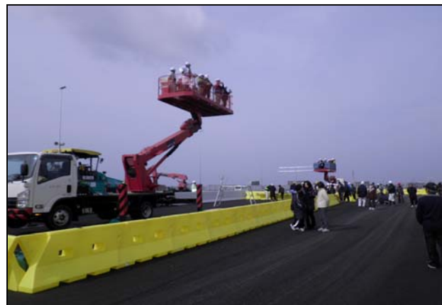
高所作業車の試乗体験のようす