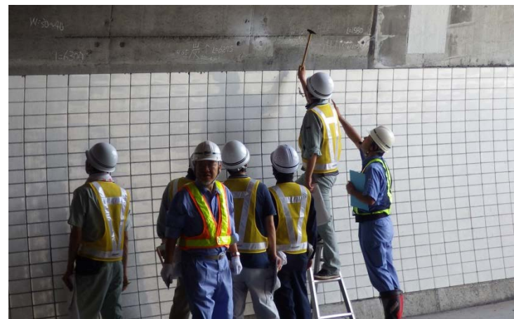
現地実習状況 (H28トンネル初級)