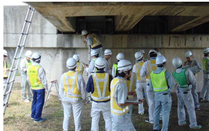
現地実習状況 (H28橋梁初級 I)