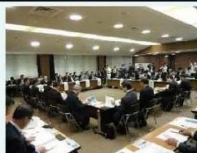
協議会の開催状況