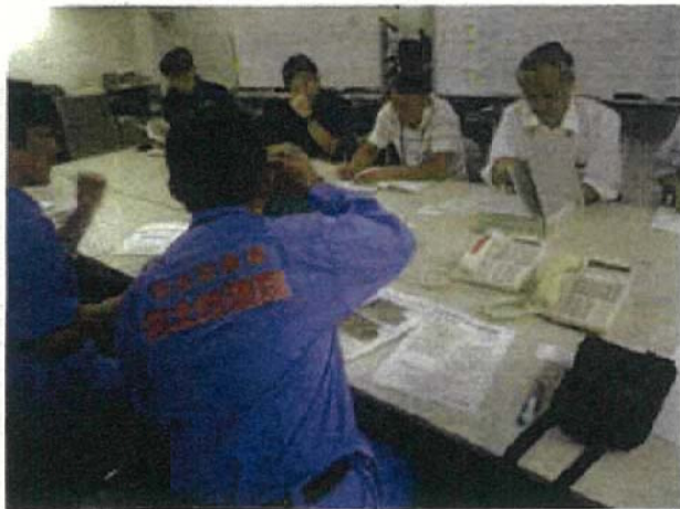
被災自治体に空中写真の活用を説明

広島県への国土地理院職員のリエゾン派遣(平成30年7月豪雨、延べ6名(2018/7/21~8/1))