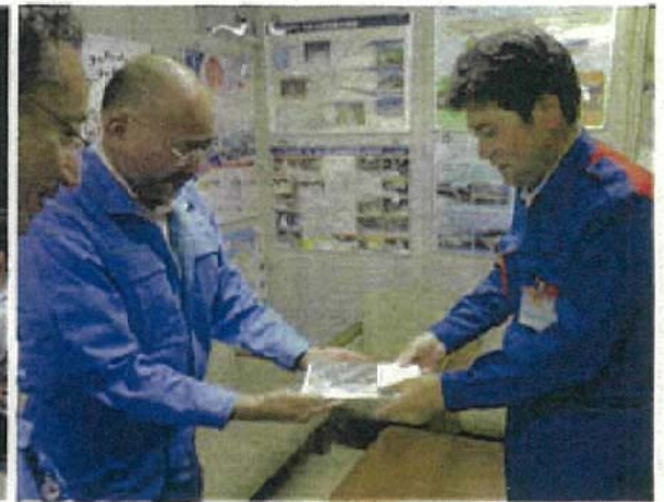
広島県土木建築局長に地形3Dモデル等を提供