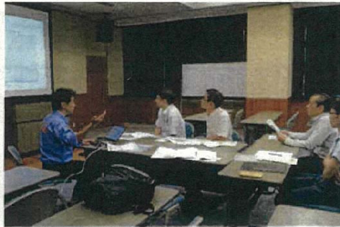
広島県における簡易GISの操作説明